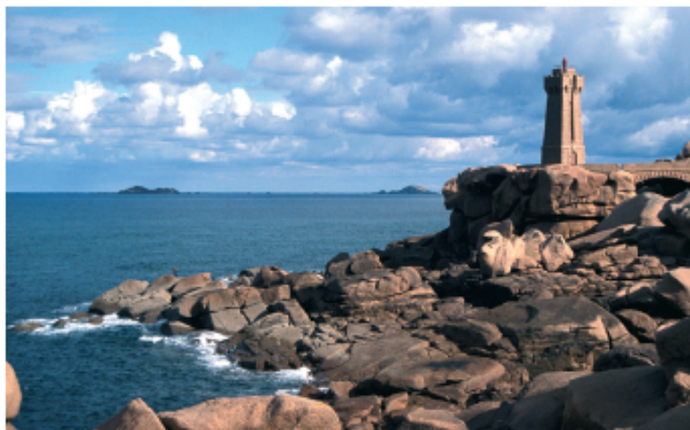
Phare de Ploumanac'h bâti sur les chaos rocheux

De tout temps, le sentier des douaniers 8 fut parcouru, défendu et protégé par les populations locales qui bâtirent défenses, postes d'observation et de secours. Poudrière, guérite de douaniers, phare, cale de lancement de navire de sauvetage, représentent à Ploumanac'h un authentique patrimoine taillé dans le roc.