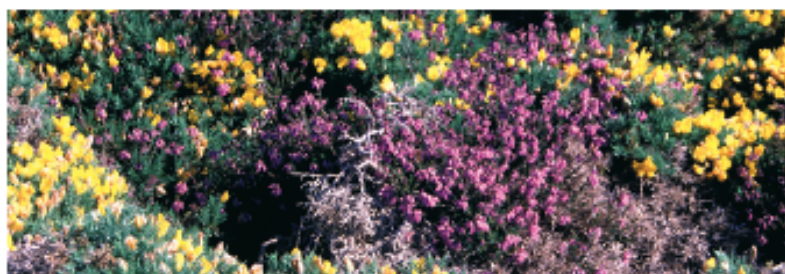
Ajoncs et bruyères