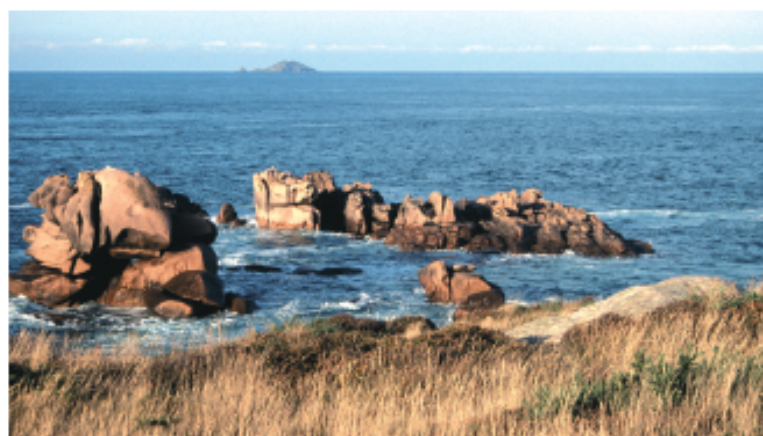
Pelouses littorales régénérées

À Ploumanac'h, de nombreuses algues parsèment l'estran. Selon qu'elles soient battues par la houle ou abritées dans les criques, elles présentent de multiples espèces. Le varech vésiculeux, algue brune aux multiples flotteurs, affectionne les eaux moyennement agitées. Il vit accroché aux rochers, dans la zone de balancement des marées. Une longue laminaire, le baudrier de Neptune, préfère les chenaux sableux où s'écoulent lentement les flux marins. Du côté d'Ar Skevell, arroches du littoral, bettes et matricaires maritimes poussent sur les laisses de mer constituées de débris animaux et végétaux. Ici, les landes sont multiples. Couvertes d'ajoncs de Le Gall, de bruyères cendrées et de callunes, elles se présentent rases et sèches. Molinies et bruyères à quatre angles annoncent la présence de sols plus humides. Pour le plus grand bonheur des passereaux, fougères, genêts et ronces se sont implantés sur les sols plus profonds naguère cultivés. Ils forment d'épais abris.