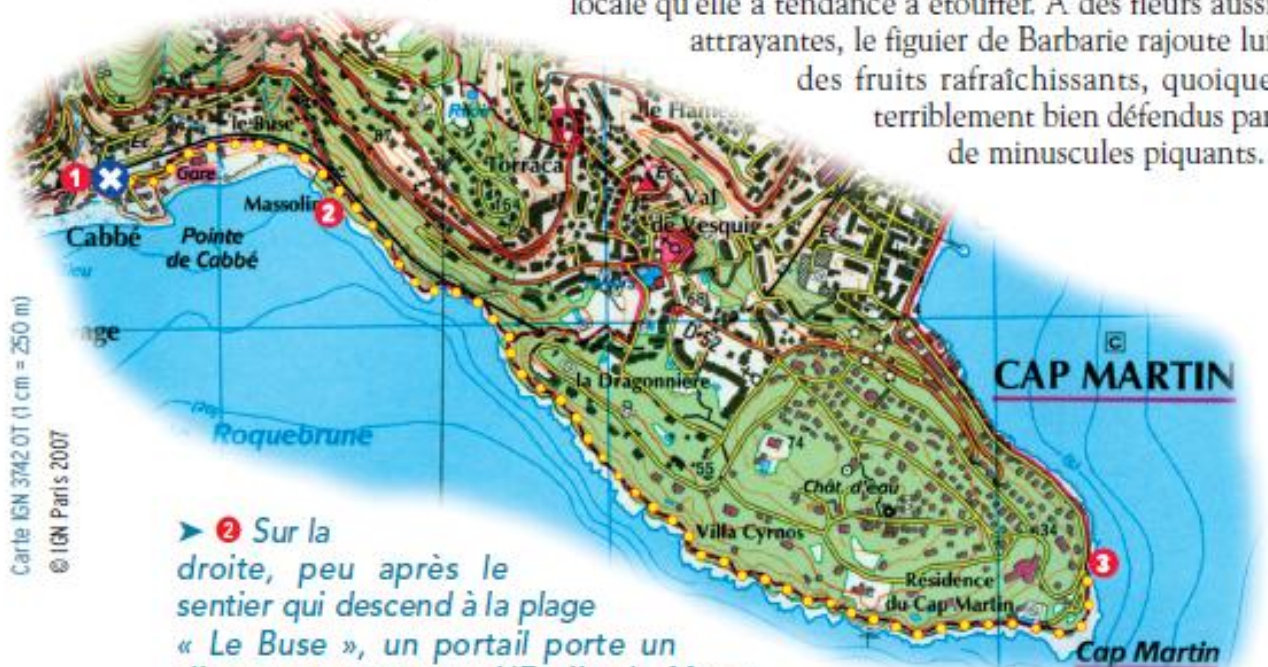
Carte IGN 3742 01 (1 cm = 250 m)

Au bord du premier tronçon, les poteaux et fils téléphoniques s'ornent de guirlandes d'ipomées aux grandes fleurs en trompette violette. Cette espèce, pour décorative qu'elle soit, n'en reste pas moins une menace pour la végétation locale qu'elle a tendance à étouffer. A des fleurs aussi attrayantes, le figuier de Barbarie rajoute lui des fruits rafraîchissants, quoique terriblement bien défendus par de minuscules piquants.