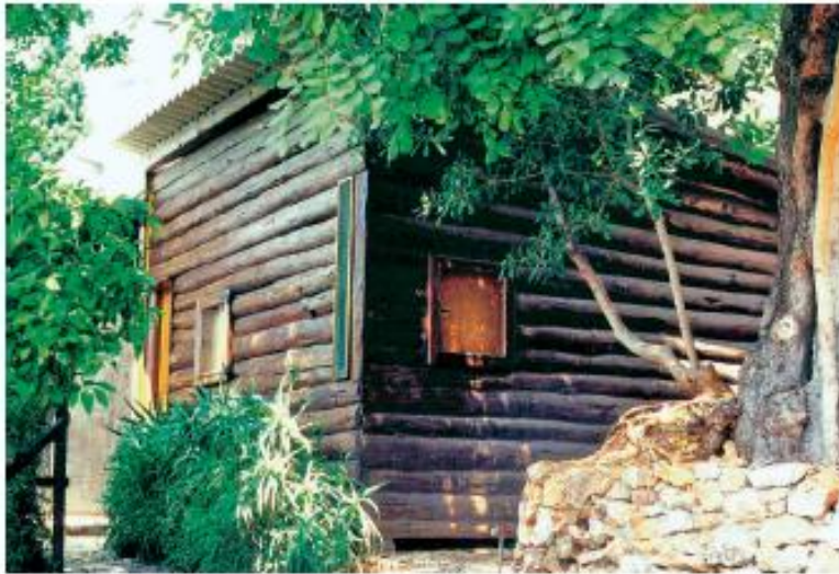
Cabanon Le Corbusier

optimales sont réunies, elle peut atteindre des tailles respectables. Une des particularités de sa croissance permet d'estimer facilement son âge. En effet, chaque année les rameaux se divisent pour en donner deux nouveaux, ni plus, ni moins. En comptant le nombre de fourches qui séparent l'extrémité d'une branche de la base du tronc on obtient donc l'âge de la plante.