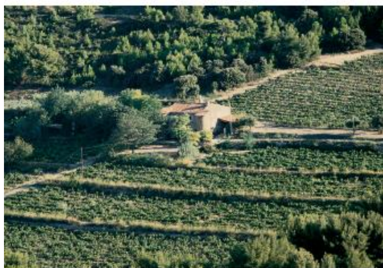
La Bastide de la Nartette au milieu des vignes

► Vous débouchez bientôt sur la Bastide de la Nartette entourée par les vignes ❷.