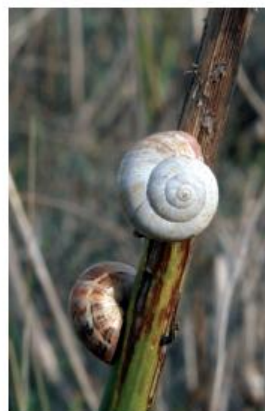
Limaçons de Pise sur une tige de fenouil

► Après la bergerie, prenez sur votre gauche par le chemin d'exploitation qui longe la N 139, allez jusqu'aux grosses pierres qui bordent le parking ❺ puis engagez-vous à travers la pinède.