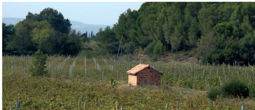
Culture de vignes réimplantées à Frescati

Sur ces contreforts montagneux souffle la tramontane, vent puissant qui permet de faire de ce territoire l'un des tout premiers parcs éoliens de France. Du plateau, vous pouvez apercevoir les pales des éoliennes qui tournent dans le paysage.