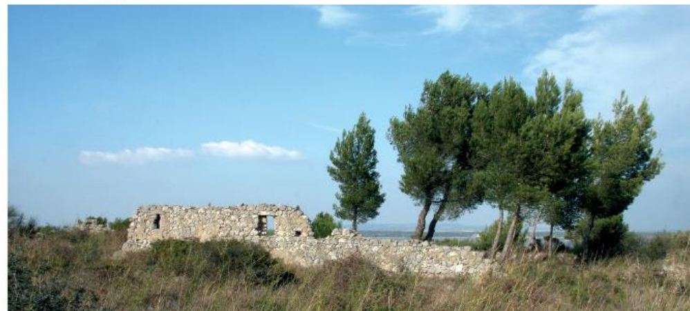
Ancienne bergerie sur le plateau de Frescati

Ainsi installé, le séneçon du Cap n'est pas prêt de disparaître. Aussi, avant toute introduction de nouvelles plantes dans un milieu équilibré, peut-être est-il bon de réfléchir à l'impact qu'elles génèrent.