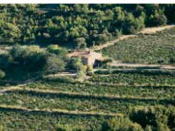
La Bastide de la Nartette au milieu des vignes

➤ Environ 50 mètres après la chaîne, prenez le sentier étroit qui part sur la gauche et se faufile sous les pins couchés par le vent et longe la petite plage de Nation.