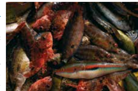
Poissons de roche au retour de la pêche

A l'approche de la mer, la pinède s'épanouit. Dans sa calanque, le petit port se blottit. Des eaux cristallines, les pêcheurs rapportent sars, daurades et loups pris au tramail, un filet de pêche formé de trois nappes superposées. Vous imaginez les yeux d'or du Grand-duc au creux des falaises, savourez la mélodie du merle bleu, espérez le survol de l'aigle de Bonelli. Halte féérique où le scintillement de la mer vous apporte l'énergie du retour.