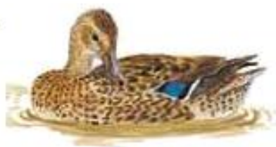
Canard colvert femelle