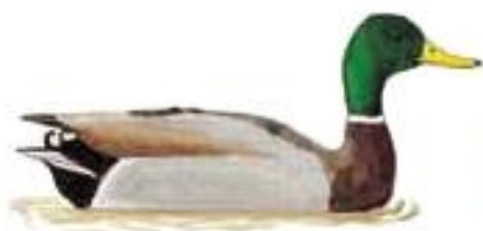
Canard colvert mâle

➤ 5 Continuez vers la droite à travers la clairière. Tournez à gauche puis suivez la piste qui mène au parking à vélos (entrée de Règue verte), tournez encore à gauche pour rejoindre le croisement en empruntant le chemin qui longe la piste cyclable 2.