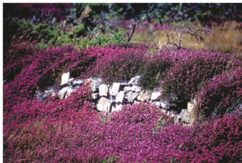
Muret - pointe de Portzen

étendues. Dans les conditions arides de l'extrême sud, seule la lande sur roche-mère a pu s'implanter. Bruyères cendrées, callunes et ajoncs de Le Gall y déploient leurs floraisons mauves et jaunes. Sur la côte ouest exposée aux éléments marins, elle a développé pour pouvoir renaître le port en coussinet, système original qui consiste à abriter les jeunes pousses de l'année derrière celles des années précédentes. Bruyères à quatre angles et ciliées ont prospéré sur les sols plus ou moins humides tandis que se sont échappés des enclos de pierre les ajoncs d'Europe, cultivés naguère pour la litière et l'alimentation animales. Les pins maritimes, plantés au siècle dernier entre les deux guerres, ont colonisé la surface orientale du cap de la Chèvre. Ils menacent désormais de fermeture un paysage qui jusqu'alors n'était constitué que de végétation rase. En lisière des sentiers, comme pour baliser le cheminement d'un bleu électrique, apparaît la crozonaise, plante typique de la presqu'île de Crozon.