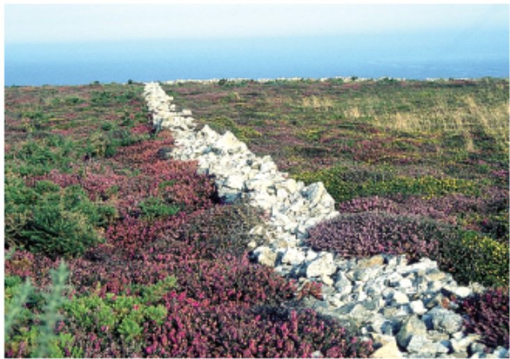
Lande rase au cap de la Chèvre

“Quand viennent les chatons aux saules, fini l'hiver dur” est un dicton qui, au pays, annonce l'arrivée des beaux jours. Dans les vallons humides, le pollen des saules cendrés se libère au printemps pour envelopper de sa duveteuse pellicule iris d'eaux et osmondes royales. Lavoires et fontaines captent les sources qui jaillissent à proximité des falaises.