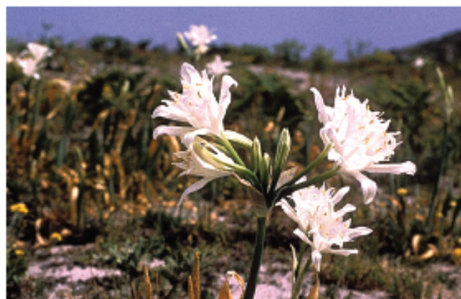
Lis des sables

Limite nord pour de nombreuses espèces méridionales, Hoëdic bénéficie d'un climat particulièrement clément. La santoline maritime, essence méditerranéenne s'il en est, a trouvé sur les côtes sableuses de l'île un havre pour épanouir son beau feuillage et diffuser en Bretagne son parfum de sud. Venus des côtes d'Espagne et du Portugal, les œillets des dunes parsèment au printemps, de leurs pétales roses finement découpés, les sables gris. D'août à septembre, les sublimes fleurs blanches des lis de mer jonchent les rivages du levant. Pour peu, on se croirait au pays des cigales si à l'ouest battu par les embruns, il n'y avait sur les cordons de galets les larges feuilles des choux marins, sur les pelouses dunaires les longs poils soyeux des queues de lièvre et plus à l'intérieur, les landes rases à ajoncs prostrés. Dans les dépressions et les prairies humides, la végétation s'est élevée. L'orchis lâche égaye les étendues vertes de sa belle teinte violette tandis que parmi la végétation lacustre de Paluden, scirpes des lacs et laïches des sables bordent les hauts roseaux.