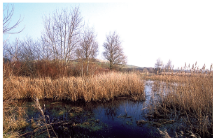
Marais de Paluden

Gravelots, bécasseaux et tournepierres arpentent la grève ③ chacun selon son style. Les grands gravelots courent sur quelques mètres puis soudain s'arrêtent, happent une proie, puis s'envolent pour se reposer à faible distance. Les bécasseaux variables, en quête de petits mollusques, trottaient inlassablement au bord des vagues tandis que les tournepierres à collier, pour se nourrir de vers et de crustacés, retournent les cailloux d'un vif coup de bec.