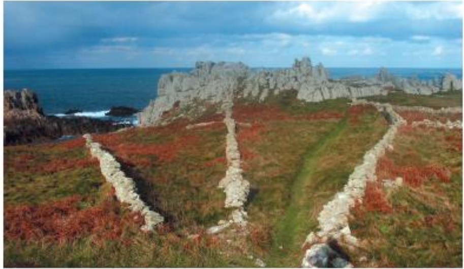
Murets orientés à tous vents