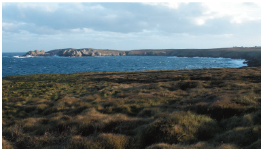
Côte nord d'Ouessant

Un peu partout sur l'île, subsistent les socles en pierre 8 de petits moulins à vent qui servaient autrefois à moudre le grain pour assurer une part de l'autonomie alimentaire d'Ouessant.