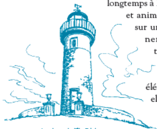
Le phare de l'île Tristan

longtemps à l'alimentation humaine et animale. Les espèces fixées sur un substrat ne contiennent aucune substance toxique. Consommées crues, elles apportent sels minéraux et oligo-éléments. Certaines d'entre elles jouent même un rôle thérapeutique.