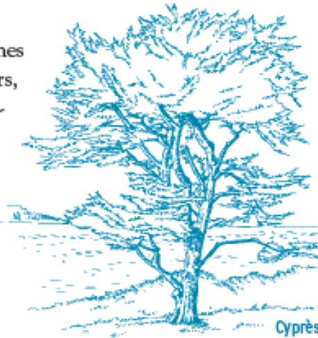
Cyprès de Lambert

Un vaste verger accueille d'anciennes variétés d'arbres fruitiers. Pommiers, poiriers, cognassiers, néfliers ou pruniers y mûrissent à l'abri du vent. Bordé d'allées aux tilleuls centenaires, il témoigne d'une époque où l'île essayait de vivre de ses productions.