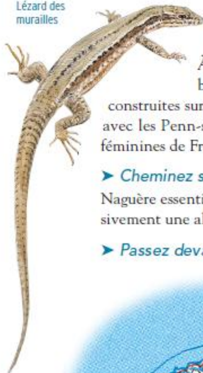
Lézard des murailles

► De la cale, prenez le portail de bois à droite du bâtiment et allez sur le chemin côtier.