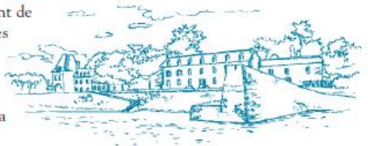
Quais et sardinerie

Araucarias, cyprès et cèdres donnent de Tristan une image d'île dérivée des chaudes latitudes. Pourtant, sa flore endémique est caractéristique du littoral breton. Avec 158 espèces recensées, la végétation annonce la diversité des milieux présents.