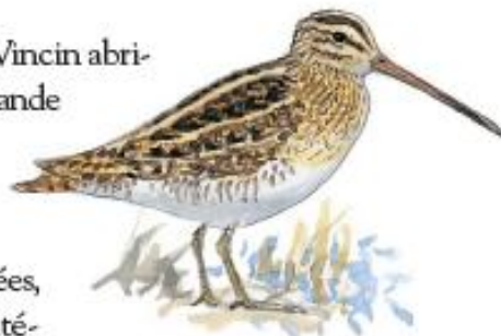
Bécassine des marais

Les étendues humides du Vincin abritent une avifaune d'une grande diversité. Migrateurs ou sédentaires trouvent ici gîtes et couverts. Avec près de 110 espèces recensées, ce site présente un réel intérêt ornithologique. Les bécassines