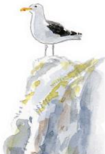
Goéland marin sur un rocher