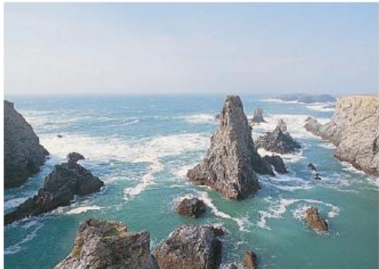
Schiste noir tourmenté

► Vous rejoignez la pointe des Poulains après la crique de Penhoët et une petite maison blanche aux tuiles rouges (ancien atelier de Clairin, peintre et ami de Sarah Bernhardt).