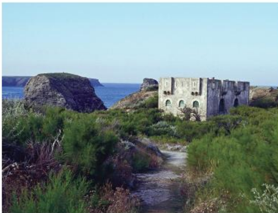
Le fort de Sarah Bernhardt

Parmi les oiseaux marins de l'île, on observe facilement à la pointe des Poulains plusieurs goélands, dont les goélands brun, argenté, marin et leucopnée, moins commun. Cormorans huppés et huîtres-pies nichent sur tout le pourtour de Belle-Île. Aujourd'hui, plus de 70 craves à bec rouge sont recensés à Belle-Île, alors qu'il n'y avait que 30 couples en Bretagne en 1970. Plus rares, le grand corbeau et le pigeon biset, cavernicole, se reproduisent également sur les rives rocheuses. Trois rapaces nocturnes sont parfois aperçus : la chouette effraie, le hibou moyen-duc et le hibou des marais. En plus des faucons crécerelles et des éperviers, présents toute l'année, l'île est fréquentée par les faucons pèlerin et émerillon et par les busards des roseaux et Saint-Martin en hiver. Dans les marécages retentissent au printemps les grognements surprenants du râle d'eau et les trilles sonores de la bouscarle de Cetti, une fauvette des marais.