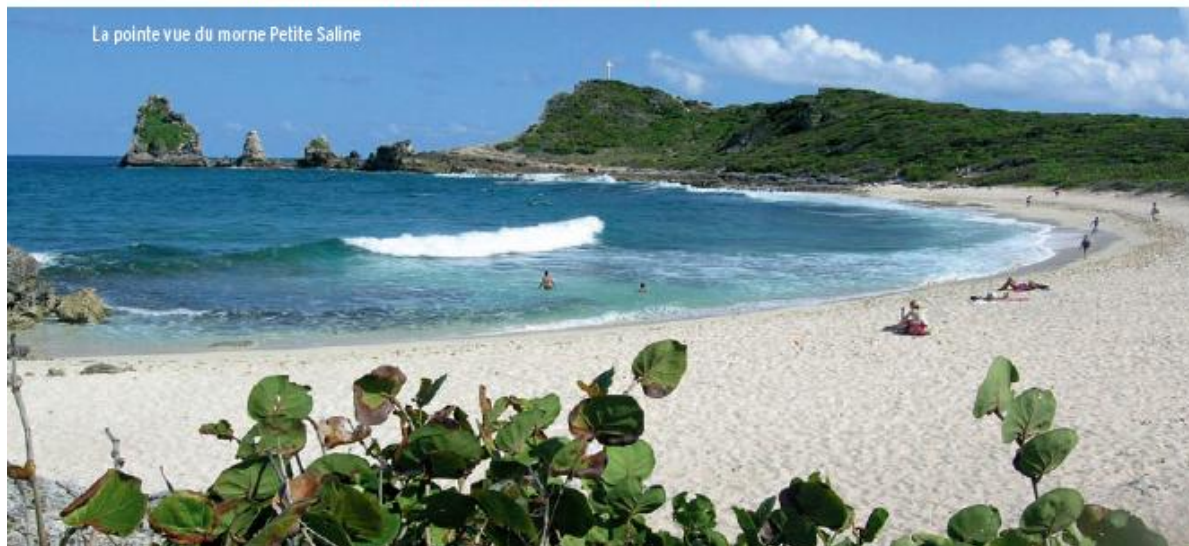
La pointe vue du morne Petite Saline

➤ 4 Vous atteignez le morne Pavillon et la croix après avoir gravi les très belles marches taillées dans le calcaire.