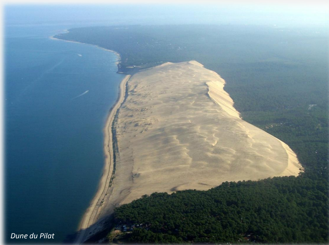
Dune du Pilat

(hectares protégés par le Conservatoire du littoral sur le Grand Site concerné)