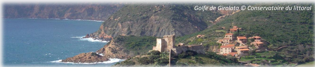
Golfe de Girolata