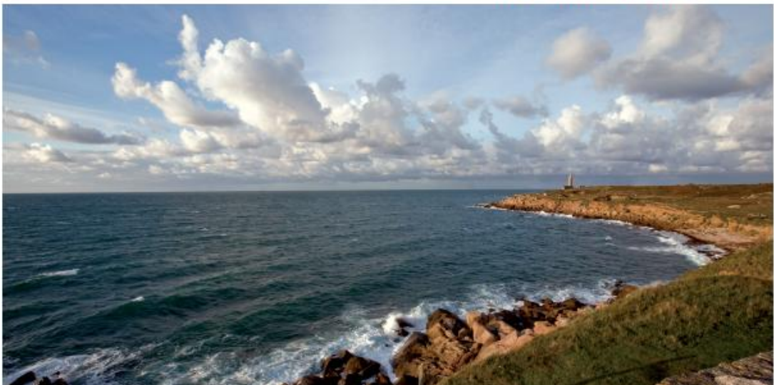
Le cap Lévi et son phare depuis le fort

La lande du Brûlé a longtemps été un terrain militaire, il n'a été récupéré qu'en 1990 par le Conservatoire du littoral. C'est d'ailleurs pour l'agrandissement d'une piste d'atterrissage voisine que la carrière avait été mise en exploitation. L'un des nombreux blockhaus qui parsèment la lande, le plus grand, présente une particularité : construit par l'armée française dans les années 30, il ne fut jamais achevé. Il se signale par la différence d'architecture, et surtout d'épaisseur : le béton des blockhaus allemands mesure plus d'un mètre d'épaisseur, celui du français ne fait que 30 centimètres. Il avait été conçu comme poste de commandement avec vue sur la rade de Cherbourg. Pendant l'Occupation, l'armée allemande n'a pas manqué de l'utiliser.