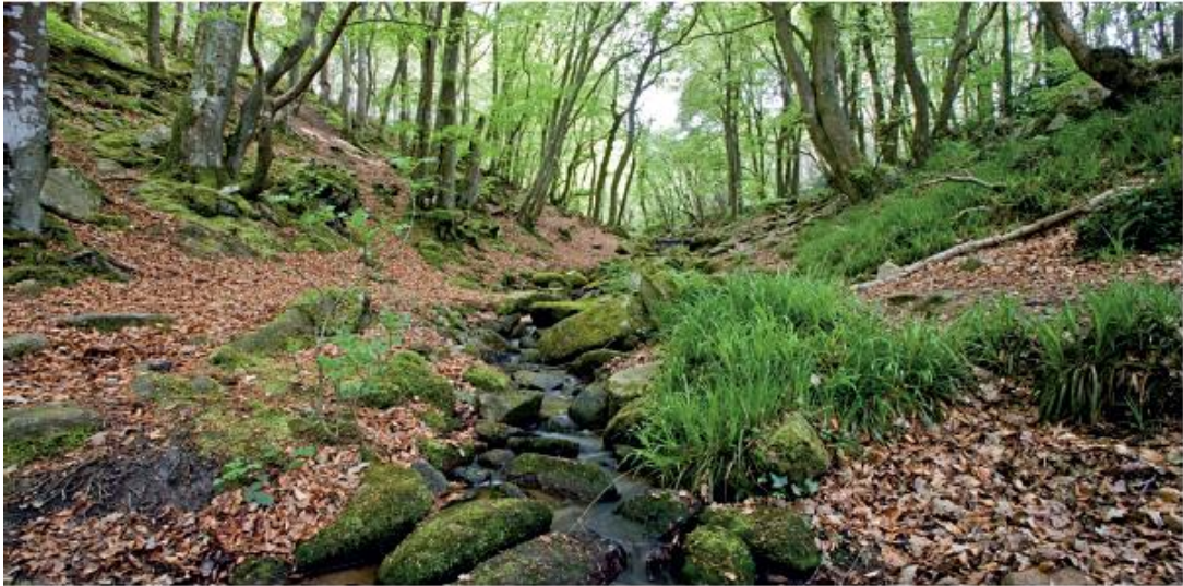
Vallon du Vivier

en processus de reboisement. Ici, la population d'oiseaux est variée : parmi les passereaux, la fauvette pitchou, et chez les rapaces : le faucon hobereau, le busard Saint-Martin. Espèce rare, l'engoulevent d'Europe, un migrateur présent l'été, petite merveille secrète, à guetter – et à entendre – à la nuit tombée. De même que, à l'arrière du site, le hibou moyen-duc, qui niche dans les pins, le hibou des marais et la bécasse des bois. Quant à la bécassine des marais, c'est plutôt sur la lande humide, et l'hiver, que vous avez des chances de l'apercevoir.