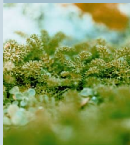
ALDO SOARES / CDL

À l'occasion de l'Année internationale de la biodiversité, le Conservatoire du littoral dresse le bilan de l'état du patrimoine naturel sur ses terrains. Grâce à l'inventaire de la faune, de la flore et des habitats conduit depuis 2007 sur 450 sites, avec le Muséum national d'histoire naturelle, la Ligue pour la protection des oiseaux et les Conservatoires botaniques nationaux, il dispose aujourd'hui d'un nouvel état de référence qui fait écho à celui dressé en 1995 et financé par la Fondation P&G. Cette synthèse nationale souligne l'importance de la responsabilité de l'établissement concernant certaines espèces et milieux inféodés aux espaces littoraux. Les sites du Conservatoire occupent une place prépondérante parmi les marais de l'ouest, les lagunes languedociennes et la Camargue, qui constituent les zones principales d'accueil de ces oiseaux. Le Conservatoire abrite un peu plus de 25 % de la flore protégée sur le territoire français, soit 149 espèces réparties sur 301 sites.