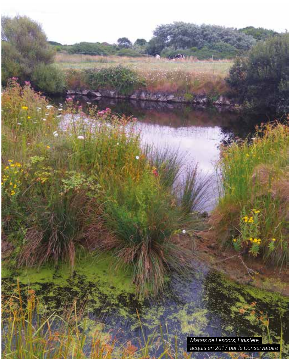
Marais de Lescors, Finistère, acquis en 2017 par le Conservatoire

Directeur de la publication : Odile GAUTHIER Rédactrice en chef : Anne KONITZ Création : LINER Communication Impression : P.D.I. - Ce magazine est édité à 10 000 exemplaires