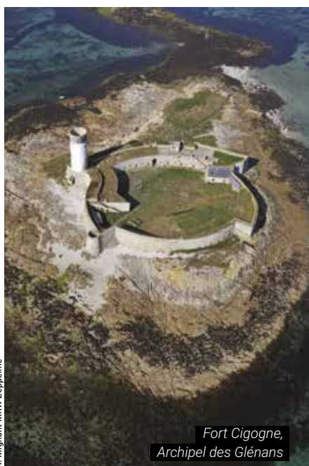
Fort Cigogne, Archipel des Glénans

CONTACT : Délégation Bretagne bretagne@conservatoire-du-littoral.fr