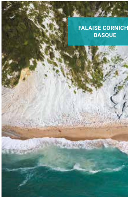
FALAISE CORNICHE BASQUE