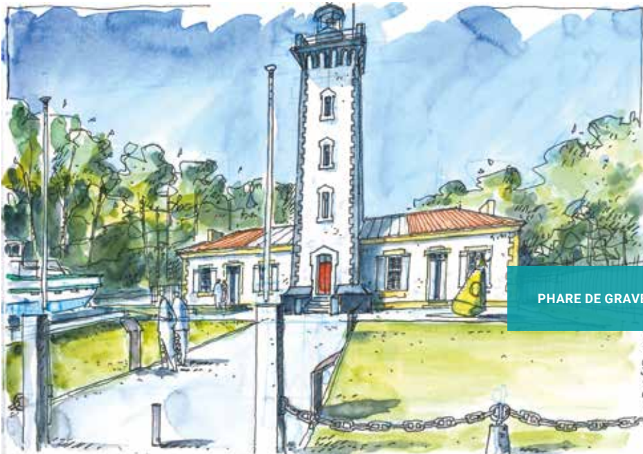
PHARE DE GRAVE