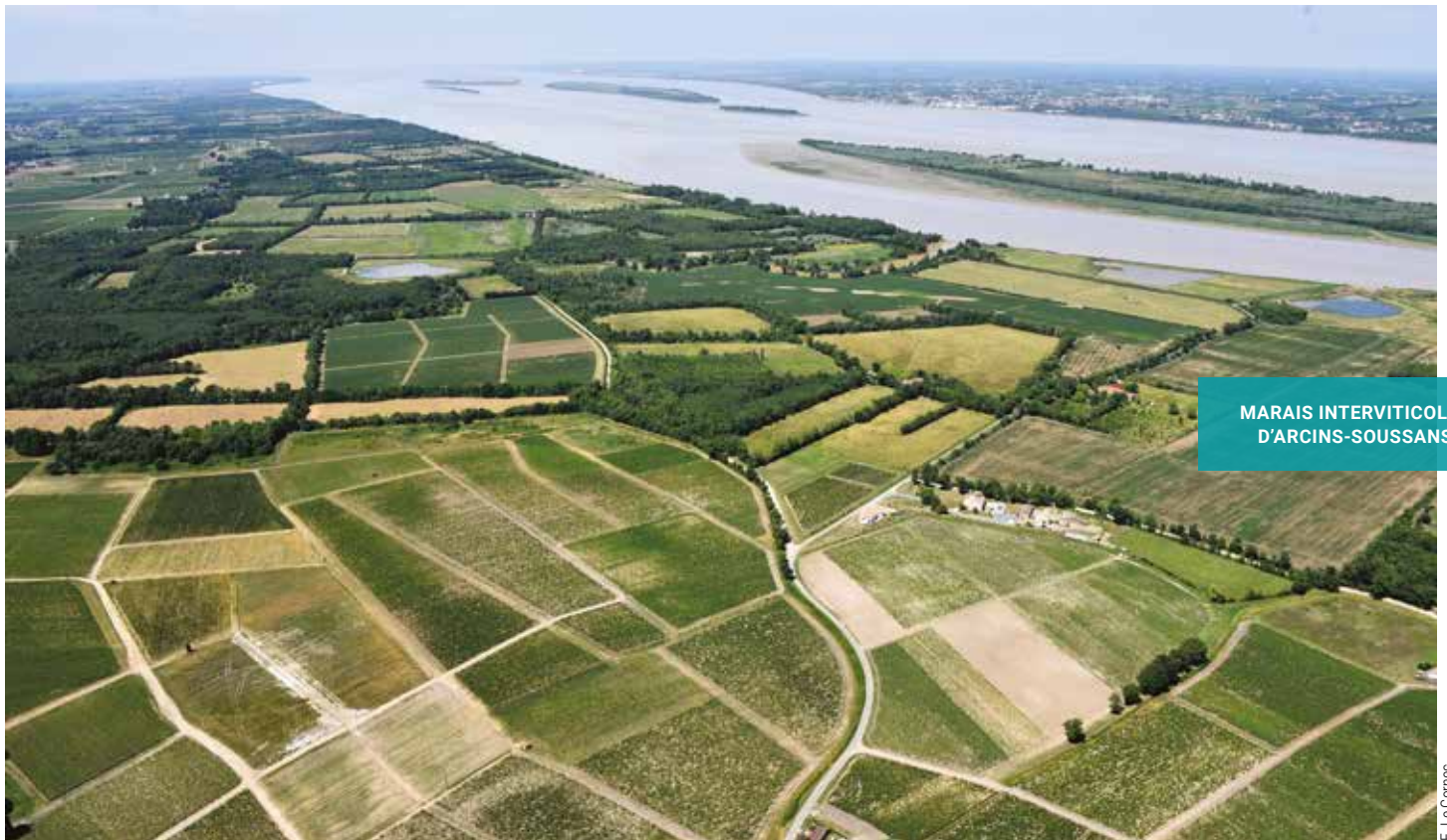
MARAIS INTERVITICOLES D'ARCINS-SOUSSANS

Le projet porté par le Conservatoire s'inscrit dans le cadre de l'appel à projet « Valorisons et restaurons les zones inondables ! » lancé en 2016 par l'Agence de l'eau Adour-Garonne et la Région Nouvelle-Aquitaine. Il bénéficie également de financements FEDER.