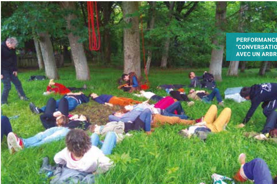
PERFORMANCE : "CONVERSATION AVEC UN ARBRE"