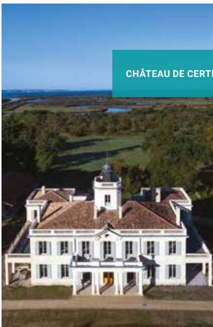
CHÂTEAU DE CERTES