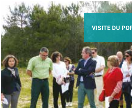
VISITE DU PORGE