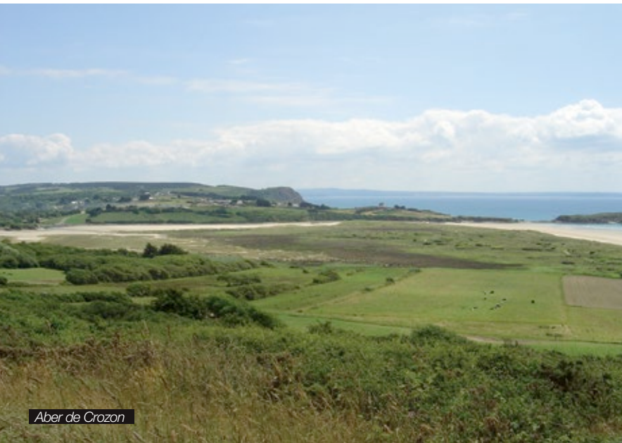
Aber de Crozon