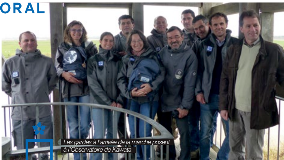
Les gardes à l'arrivée de la marche posent à l'Observatoire de Kawata

“ Cette marche est représentative de la bonne dynamique du réseau des gardes du littoral. Le carnet de terrain est une mine d'or : dessins, écrits, photos... Nous allons en faire des reproductions car il faut que ce carnet voyage ! ”