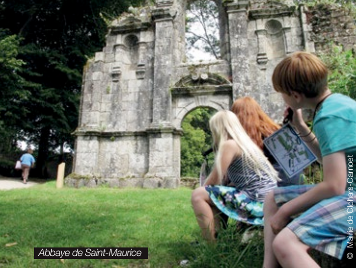
Abbaye de Saint-Maurice