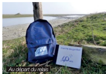
Au départ du relais

Ces agents, employés par des collectivités ou des associations, ont pour mission de protéger et d'entretenir les sites du Conservatoire. Agents d'accueil, animateurs, naturalistes, gardiens, leurs multiples fonctions font d'eux des partenaires essentiels du Conservatoire du littoral.