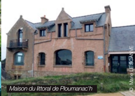
Maison du littoral de Ploumanac'h