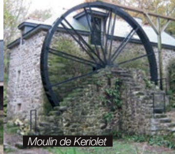
Moulin de Keriollet