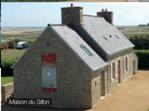
Maison du Sillon