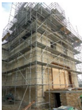
La maison de maître

La première phase de la réhabilitation porte sur la restauration de la structure du bâtiment et sur le clos-couvert pour un montant de 385 000 euros. D'autres phases de travaux de réhabilitation de l'intérieur du bâtiment permettront, entre autres, de pouvoir y accueillir le public.