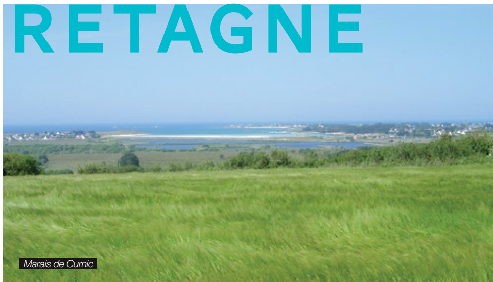
Marais de Cumic

Directeur de la publication : Odile GAUTHIER Rédactrice en chef : Anne KONITZ - Conception éditoriale, rédaction : Partie de Campagne - Création, maquette, mise en page : LINER Communication Impression : P.D.I. - Ce magazine est édité à 2000 exemplaires