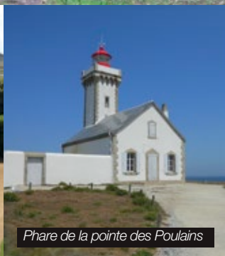
Phare de la pointe des Poulains