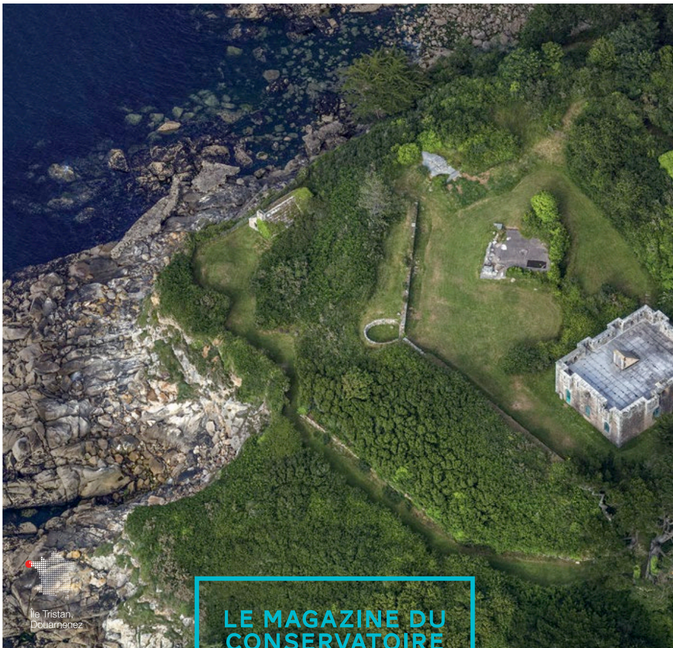
Île Tristan, Douarnenez

6 | 80 GARDES BRETONS SE PASSENT LE RELAIS