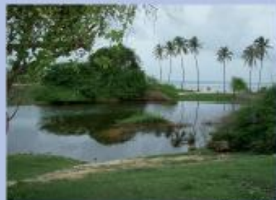
Bois Jolan, au sud de la Grande Terre

La côte sud de la Grande Terre est bordée de longues plages de sable blanc et de lagons protégés par une barrière de corail, en alternance avec des plateaux calcaires à la végétation xérophile rase. De nombreux marais jalonnent un paysage de prairies littorales pâturées et de champs de canne. À l'inverse, les rivages des côtes est et nord sont sculptés par la houle venue de l'Atlantique, formant de superbes falaises. On y rencontre des beach rocks, plages anciennes dont les sables ont été durcis, puis érodés avec le temps, et des plages bordées de fourrés secs et de forêts sur sable.