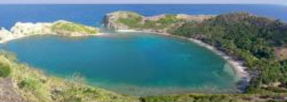
Paysage, à Terre-de-Haut des Saintes

Gestionnaires : DNF, association « Ti-Tè » Îles de la Petite Terre (79 ha ; parcours d'interprétation)