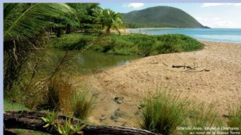
Grande Anse, située à Deshaies, au nord de la Basse Terre

Situé au nord de la Basse Terre, où règne le climat sec de la côte sous le vent, le site de Gros Morne/Grande Anse révèle un habitat rare formé d'une forêt sèche arrivée à un stade climacique – c'est-à-dire à un point d'équilibre parfait – et d'un cordon sableux orangé de près d'un kilomètre et demi, la plage de Grande Anse, propice à la ponte des tortues marine. ★