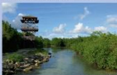
Tour d'observation du marais de Port-Louis

nagement foncier et d'établissement rural). Au nord-est, le Grand Cul-de-sac Marin se prolonge à l'intérieur des terres pour former une vaste zone de mangrove, vasières, prairies humides et forêt inondée : le marais nord de Port-Louis . Hier très fortement menacé par un projet portuaire, le site fait finalement l'objet d'une protection foncière par le Conservatoire, en partenariat avec la municipalité, la population et les associations. Aujourd'hui, un sentier sur callebotis et une tour d'observation permettent une découverte originale de la mangrove et de son incroyable richesse. ☆