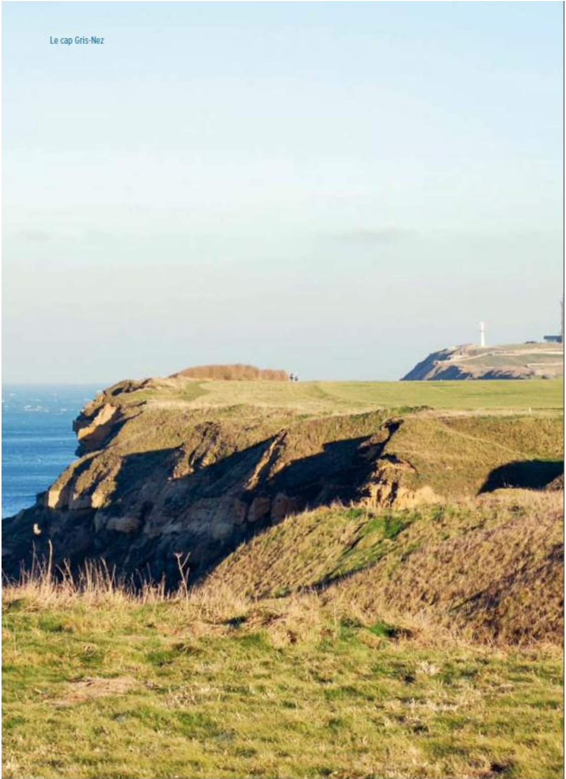
Le cap Gris-Nez