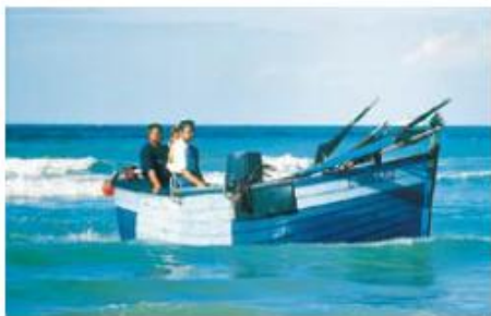
Le fond du flobart peut être presque aussi large que long

Le flobart* est massif à l'avant et possède un tirant d'eau réduit au minimum. Il utilise le gréement de bourcet-malet, commun à la plupart des bateaux de la région au temps de la voile et, cas unique en Europe occidentale, dispose d'une dérive centrale en puits. Beaucoup de ces embarcations ont aujourd'hui disparu ; elles font partie des derniers bateaux de plage français !