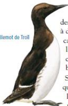
Guillemot de Troil

Une nouvelle halte s'impose pour découvrir à nouveau la baie de Wissant et plus précisément la dune du Châtelet, le marais de Tardinghen et plus loin la motte du Bourg. Vous traversez maintenant des milieux dunaires d'une grande variété. Plusieurs