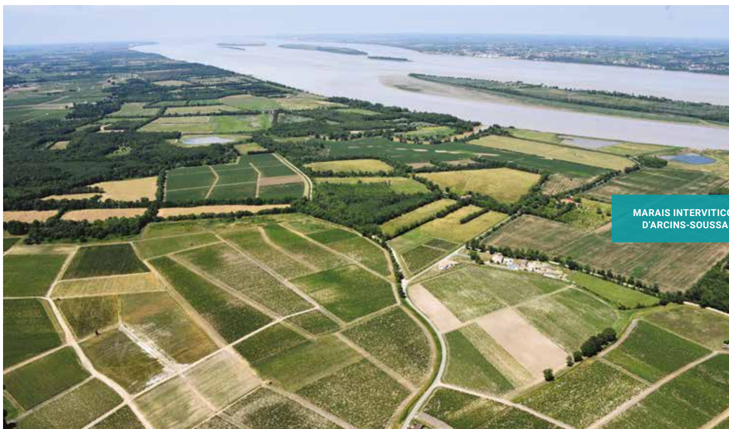
MARAI INTERVITICOLES D'ARCINS-SOUSSANS

Le projet porté par le Conservatoire s'inscrit dans le cadre de l'appel à projet « Valorisons et restaurons les zones inondables ! » lancé en 2016 par l'Agence de l'eau Adour-Garonne et la Région Nouvelle-Aquitaine. Il bénéficie également de financements FEDER.