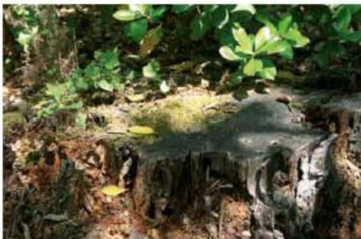
Petit chêne sur souche de pin