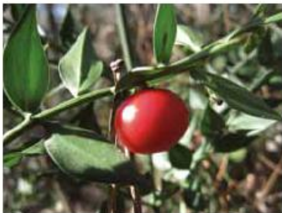
Fragon piquant ou petit houx

Selon une étude de l'Office National des Forêts, Camicas compte 17 % de "futaies adultes" de pins maritimes et 28 % de "futaies surannées", c'est-à-dire ayant passé l'âge de la récolte. La plus grande part (41 %) réside en "peuplements mêlés" de feuillus et résineux, et une portion notable (7 %) en "pinèdes très claires, mitées par l'armillaire". Peu apprécié des sylviculteurs, ce champignon pousse des câbles noirs en sous-sol, faisant mourir des centaines de pins à la ronde. C'est dire qu'à Camicas la nature est reine. Mais le Conservatoire veille à ce que ce champignon ne touche pas les forêts exploitées riveraines. A chaque pas, vous y croisez les oiseaux forestiers, des pics aux mésanges, en passant par la sittelle et le grimpereau. Plus discrets, les innombrables insectes du bois sont partout à l'œuvre. Et l'on a repéré, à l'ombre des acacias, une punaise rarissime jusque là inconnue en Gironde : "Adelphocoris reicheli". Mais vous aurez bien d'autres raisons d'admirer Camicas. Son charme est précisément de rester, au cœur de la ville, une forêt "surannée", donc bien vivante !