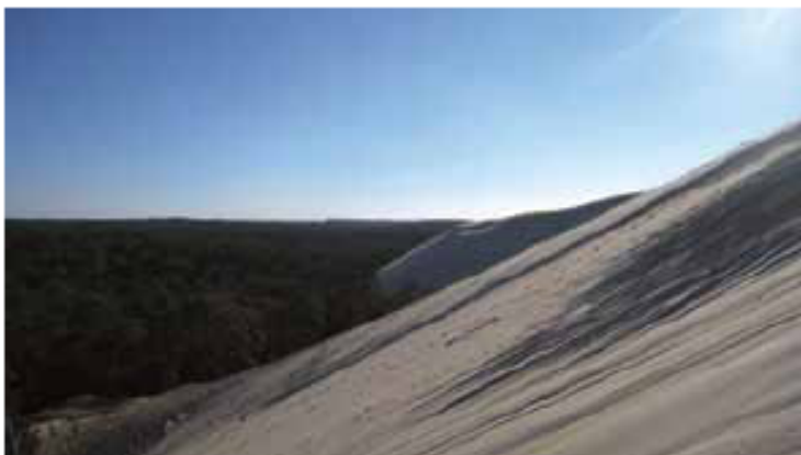
La dune s'effondre sur la pinède

La dune est si aride, si mobile et géologiquement "vivante", que vous n'y trouvez guère de plantes ni de bêtes, hormis dans les "oasis" de sa frange littorale, où des steppes d'oyats et de menues roselières et saulaies s'abreuvent aux résurgences de la nappe et autres ruissellements. Marchant de la forêt à la mer, de l'échine au ventre de la "dame blanche", votre bonheur sera aussi d'embrasser un inoubliable panorama. A vos pieds, à l'est, persiste la "forêt usagère", la plus ancienne de Gascogne. Jamais planté, le pin maritime "spontané" y atteint des tailles inouïes. A l'ouest, la marée basse découvre le banc d'Arguin, palpitant d'oiseaux, dont une célèbre colonie de sternes caugek. Au nord, se déploient le Cap Ferret et le bassin d'Arcachon, avec ses périlleuses passes. En 2007, la région Aquitaine, le département de la Gironde et la commune de la Teste de Buch créent le syndicat Mixte de la Grande Dune du Pilat. Une opération Grand Site est relancée en 2011. Le Conservatoire du littoral entre dans la danse pour achever les acquisitions nécessaires et accueillir sereinement tous ceux qui ont la dune en partage.