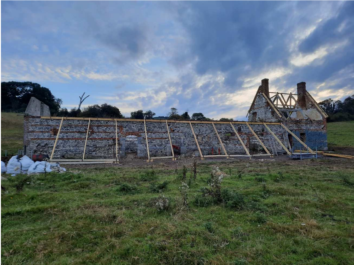
Démarrage des travaux de la grange peinte par Monet à Hautot-sur-Mer