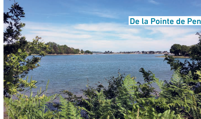
Anse de Penfoulic

À environ 50 mètres à gauche, prenez le sentier forestier 4 qui monte.