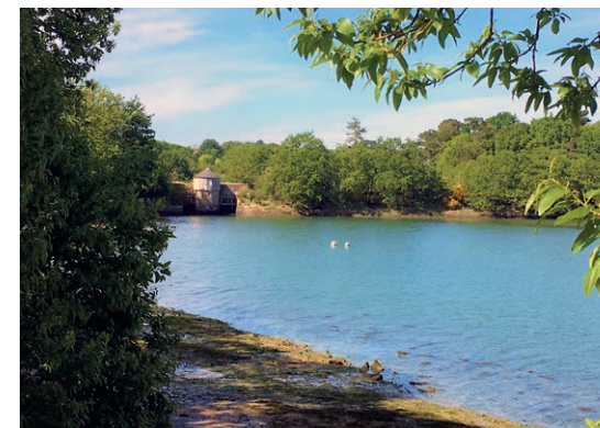
Berges du petit étang de Penfoulic