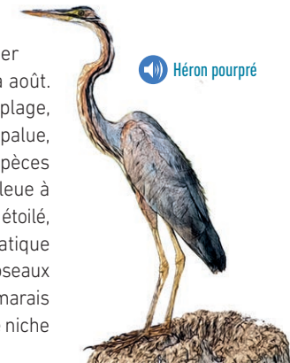
Étang de Trunvel

Le nicheur le plus prestigieux du site est le guêpier d'Europe, aux couleurs éclatantes, présent d'avril à août. Le site peut se flatter aussi de la nidification, sur la plage, des gravelots (grand et à collier interrompu) et sur la palue, du vanneau huppé. Les roselières hébergent des espèces d'intérêt patrimonial : panure à moustache, gorgebleue à miroir, ainsi que toutes les fauvettes aquatiques. Butor étoilé, héron pourpré et échasse blanche et phragmite aquatique sont d'autres visiteurs remarquables. Le busard des roseaux est toujours présent ; le faucon pèlerin et le hibou des marais fréquentent les pannes en hiver. Le faucon crécerelle niche dans les trémies de ciment du concasseur.