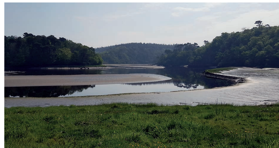
Rives de la Laïta

bois, landes et cultures. Si la "rivière aux vipères" est devenue un étang-vivier dans sa partie basse, elle a été gagnée à l'ouest par une végétation de prairies humides. L'œnanthe safranée, au redoutable poison, y côtoie la laïche paniculée dont les feuilles imprégnées de silice peuvent être très coupantes. Scirpes et joncs maritimes bordent de leurs nuances brunes et vertes la rive gauche de la Laïta.