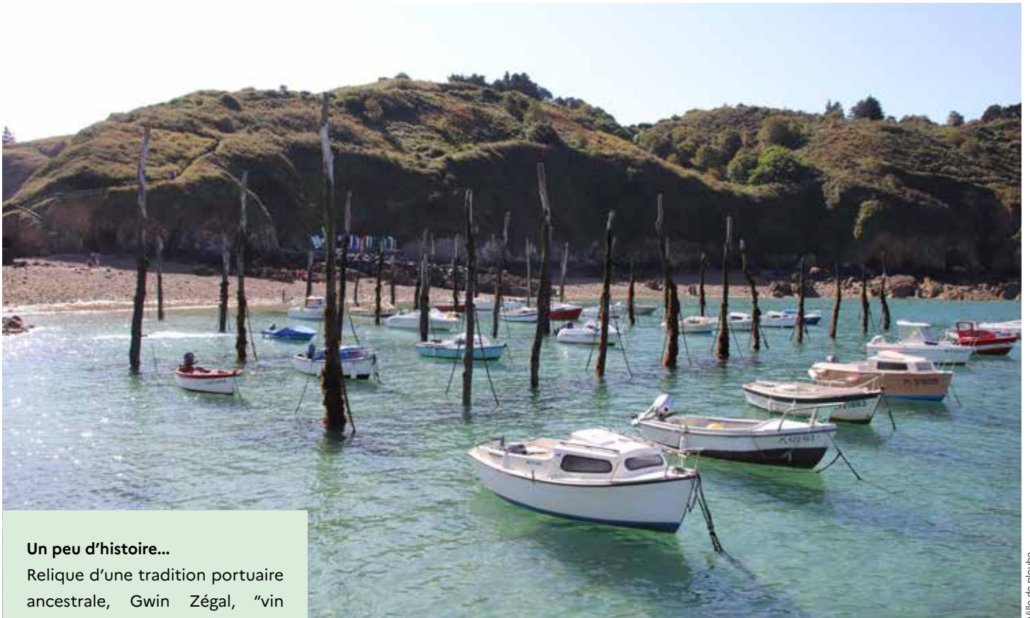
ville de plouha