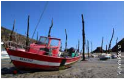
Ville de Plouha