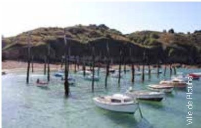
Ville de Plouha