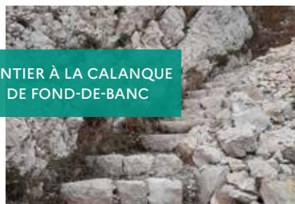
SENTIER À LA CALANQUE DE FOND-DE-BANC

Vigueirat pour la pose de clôtures à taureaux et du débroussaillage sur l'étang du Bolmon, en complément des travaux réalisés directement sur le site des marais du Vigueirat (arrachage de jussies, nettoyage du canal du Vigueirat et pose d'un platelage). Plusieurs autres chantiers de jeunes ou chantiers d'insertion se déroulent sur les sites du Conservatoire, pilotés directement par les gestionnaires de sites.