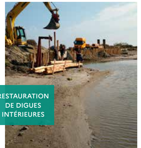
RESTAURATION DE DIGUES INTÉRIEURES

Restauration de digues intérieures et de passerelles pour l'accès piétons et cycles au public.