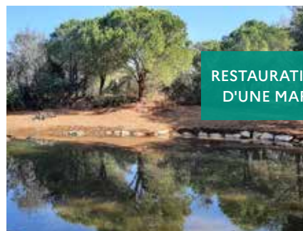
RESTAURATION D'UNE MARE

Restauration d'une mare par le Parc national de Port Cros.