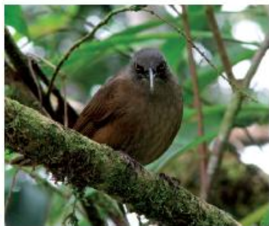
La grive trembleuse, "cocobino"

De retour vers la forêt sèche, vous rencontrerez les "zamourètes", acacias à longues branches dont les épines s'accrochent aux vêtements pour mieux embrasser le promeneur.