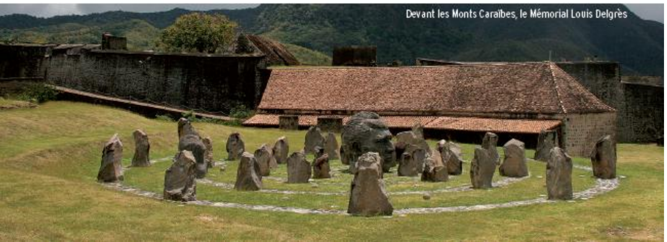
Devant les Monts Caraïbes, le Mémorial Louis Delgrès

En hommage à ce sacrifice, le fort Saint-Charles fut baptisé fort Delgrès en 1989.