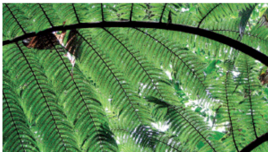
Sous les fougères arborescentes

Le morne Cadet accueille, en fonction de l'altitude et de l'exposition, forêts mésophiles* et ombrophiles*. Réduite à peu de chagrin en maints endroits de Guadeloupe du fait d'une exploitation intensive, la forêt mésophile* est aux Monts Caraïbes bien vivante. L'acajou blanc est l'une de ses essences caractéristiques. Pour reconnaître cet arbre de 6 à 9 mètres de haut, il suffit de taper sur son tronc avec les poings. Il résonne alors d'un son creux.