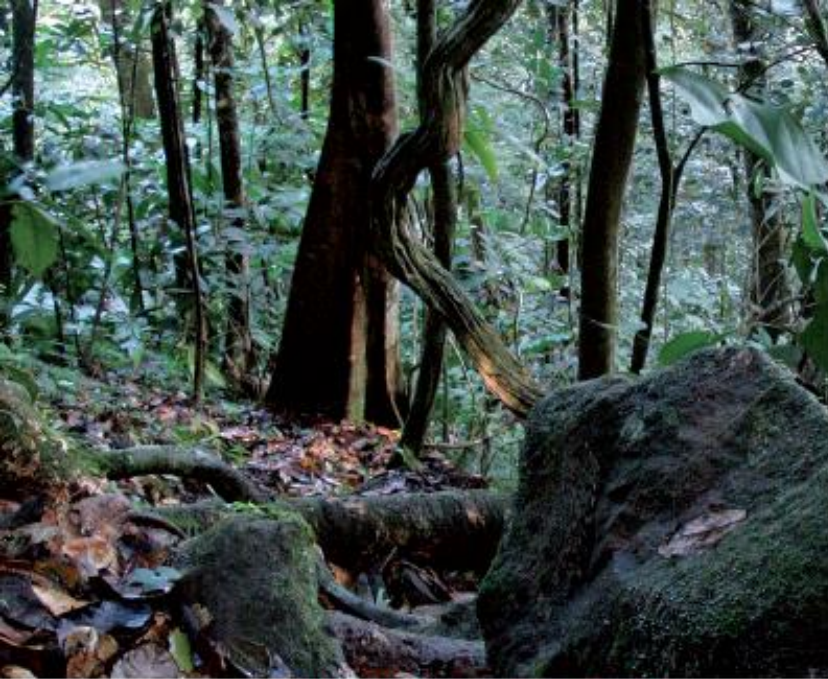
Sur les sentiers escarpés des Monts Caraïbes

végétales, c'est que vous avez rencontré le terrible figuier étrangleur. Ce figuier maudit, appelé en créole "figyé modî", a un pouvoir de nuisance extraordinaire. Il n'est jamais bon d'installer sa demeure à côté.