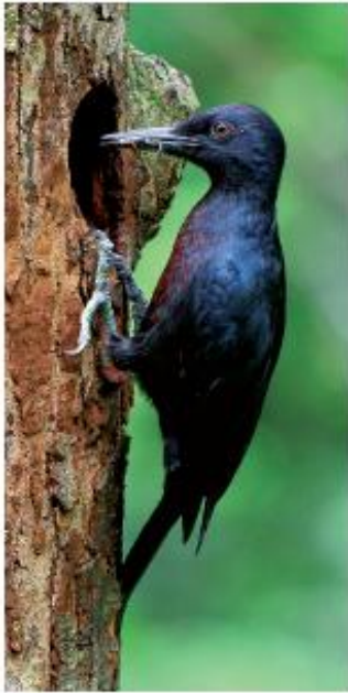
Pic noir de Guadeloupe ou "tapè"

quelques minutes, les ravines asséchées qui séparent les mornes* peuvent-elles se transformer en torrents impétueux. Il n'est pas bon alors de se trouver au creux de leur lit.