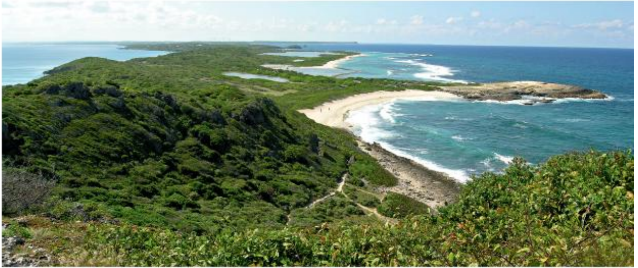
La pointe des Châteaux depuis le morne Pavillon

La pointe des Châteaux, hormis la bande des 50 Pas*, était composée de terrains privés. Pour une bonne préservation de ce site unique en son genre, le Conservatoire du littoral en fit l'acquisition. Le site bénéficie des protections les plus fortes : forêt domaniale du littoral, acquisition du Conservatoire du littoral, site classé au titre de la loi de 1930, Opération Grand Site enfin, pour prendre en compte la fréquentation touristique et mettre en place une gestion durable sur l'ensemble de la pointe.