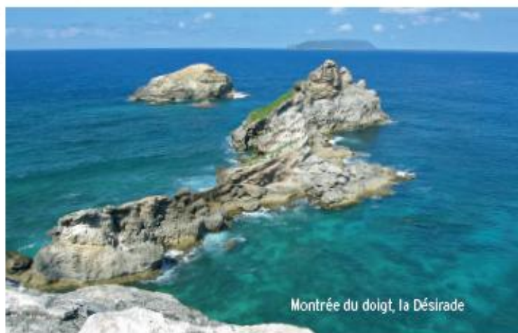
Montrée du doigt, la Désirade

De nombreux oiseaux marins fréquentent ce site fabuleux, tels la frégate superbe, les sternes, les phaétons à la plume rectale si spectaculaire qui les fait appeler paille-en-queue. Vous pouvez retourner par le même chemin, pour retrouver votre véhicule. Dans le cadre de l'opération Grand Site, des navettes seront à votre disposition pour faciliter l'accès dans les deux sens.