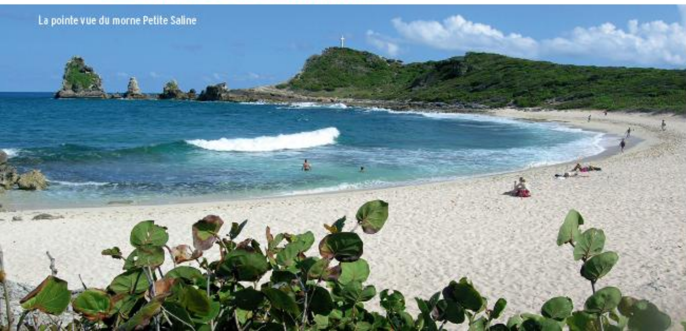
La pointe vue du morne Petite Saline

➤ 4 Vous atteignez le morne Pavillon et la croix après avoir gravi les très belles marches taillées dans le calcaire.