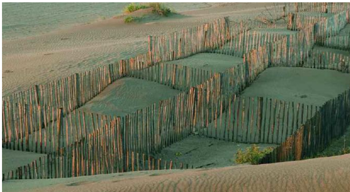
Casiers de ganivelles installés pour piéger le sable et reconstituer la dune

► Pour gagner une vue exceptionnelle sur l'ensemble de l'étang 4, montez à droite 50 m après cette borne. A l'ancienne route goudronnée, prenez à gauche sur 500 m et entre deux vignes du plateau, atteignez le point de vue (à gauche).