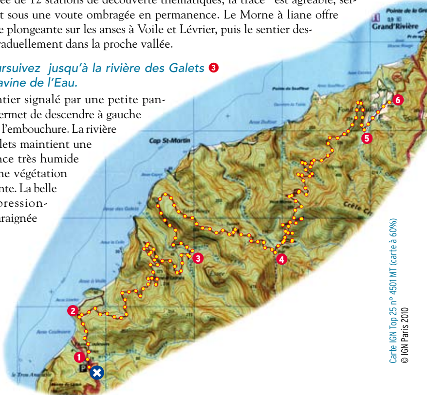
Carte IGN Top 25 n° 4501 MT (carte à 60%) © IGN Paris 2010

Un sentier signalé par une petite pancarte permet de descendre à gauche jusqu'à l'embouchure. La rivière des Galets maintient une ambiance très humide avec une végétation luxuriante. La belle et impressionnante araignée