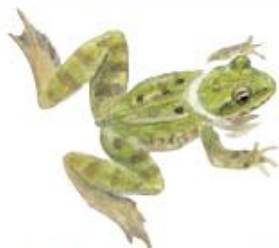
Les grenouilles vertes plongent dans les mares à votre approche.

A l'image de la région, l'architecture typique des habitations et de certaines églises est faite de bois et de terre. Les églises à pans de bois, construites au XVI e siècle, ont chacune leur originalité et leur charme. N'hésitez pas à entrer pour admirer la lumière à travers les superbes vitraux d'époque. Elles sont réunies autour d'un circuit qui présente les caractéristiques de chaque édifice.