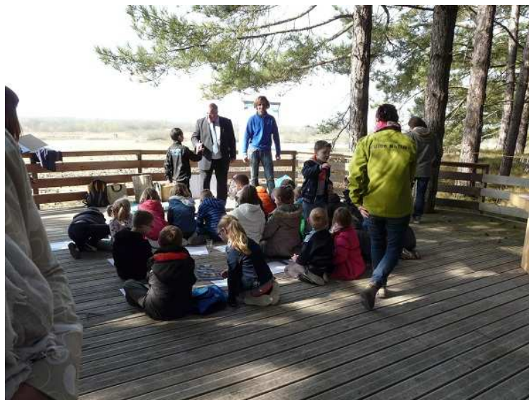
Ecole de Fort-Mahon

Vendredi 10 avril, à l'occasion du lancement de son 40 e anniversaire dans la Somme, sur le site du Parc ornithologique Marquenterre, le Conservatoire du littoral a présenté la mallette pédagogique "Au cœur du littoral". Conçue et réalisée par l'agence Katcents'coups, spécialisée dans ce type d'outil, sa réalisation a été possible grâce à la Fondation P&G pour le littoral, très investie dans l'éducation à l'environnement.