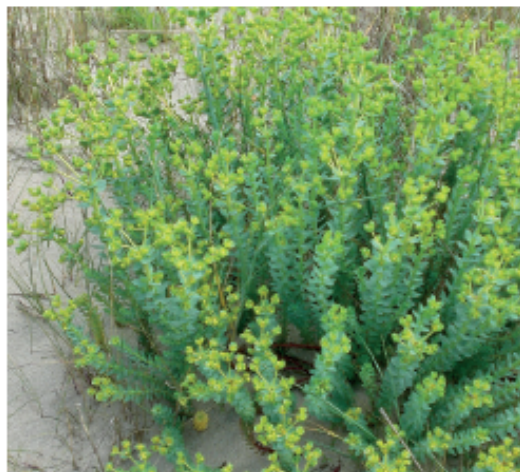
Euphorbe des dunes