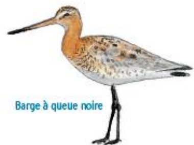
Barge à queue noire

Une réserve de chasse a été mise en place au nord de la baie de Somme dès 1968. Étendu en 1973, cet ensemble protégé a été élevé au rang de Réserve naturelle nationale, en y intégrant le Parc ornithologique du Marquenterre en 1994. De là, la confusion entre parc et réserve, mais l'essentiel est que la baie de Somme dispose avec ces deux entités d'une surface protégée très efficace, et d'un site permettant la contiguïté entre les hommes et les oiseaux. La protection n'est pas ici une mise sous cloche. Les activités de pêche s'exercent sur l'estran de la même façon que sur le reste de la baie de Somme. En dehors du Parc, les visiteurs sont sensibilisés afin de pouvoir se promener sans déranger.