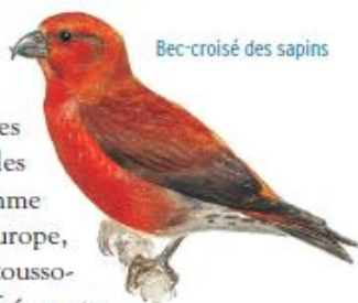
Bec-croisé des sapins

➤ Vous êtes au sommet du mont ⑦, le sentier ne mène pas plus loin. Le retour se fait par le même chemin jusqu'au premier carrefour.