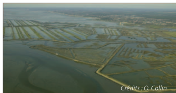
Polders de Certes et Graveyron submergés par la mer durant la tempête Xynthia

Observable sur le bassin d'Arcachon, la dépoldérisation est un moyen efficace et souple de gestion du risque de submersion. Les zones dépoldérisées fournissent en effet de nouveaux services écosystémiques et constituent une protection pour les habitats humains. Sur le site de Graveyron, les bénéfices générés par la dépoldérisation sont estimés à 724 500€ , et ce sans compter les coûts évités par l'entretien constant des digues les plus exposées dans le cas où le polder est conservé.