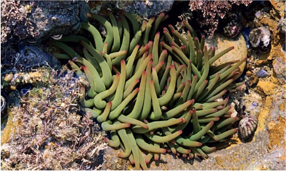
Anémone verte sur le platier rocheux

L'obélisque en hommage à la « Big Red One », la première division américaine, domine l'ensemble du site. De là, la vailleuse* de Colleville dévoile ses zones humides.