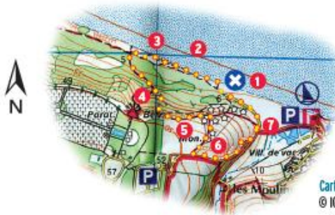
Carte IGN 1412 OT (1 cm = 250 m) © IGN Paris 2012

La préservation de ce site exceptionnel passe par la vigilance et le respect de tous.