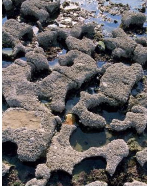
« Laplez » sur l'estran de Sainte-Honorine-des-Pertes

Sur le site d'Omaha, le Conservatoire du littoral a choisi de sauvegarder quelques de vieilles espèces de pommiers à cidre comme le Douce-Moen, le Gagnevin, le Cartigny, le Gros Bois, le Feuillard, la Clozette. Un verger AOC de plus de 300 pommiers hautes tiges est exploité par une ferme locale pour la production du précieux breuvage normand.