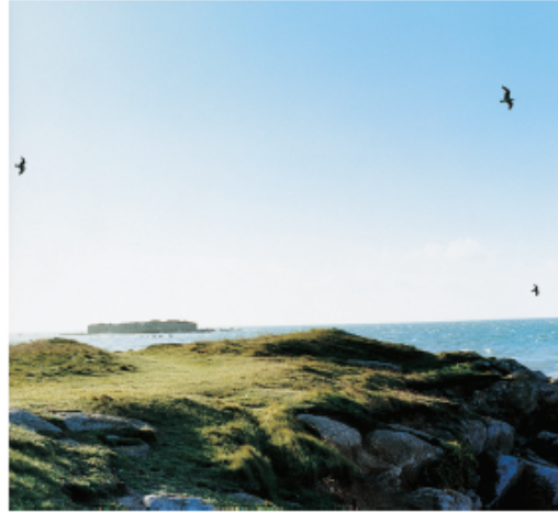
Perspective sur le fort de l'Îlet

L'armérie maritime forme en été un tapis rose près des digues sud. Les vieux murs abritent lichens, mousses et fougères. Les zones d'embruns sont colonisées par le pavot cornu (jaune), qui doit son nom à la longue capsule contenant ses graines, par l'euphorbe des sables et par la bugrane rampante, aux fleurs roses sombres. Ces trois espèces fleurissent de juin à septembre. Tatihou recèle également quelques plantes rares et protégées comme le bec-de-grue glutineux, un petit géranium sauvage, en fleurs dès les beaux jours, et le chénopode à feuilles grasses, dont les feuilles rougissent sur le dessous. La spergulaire des rochers, aux feuilles charnues et aux fleurs roses et blanches, pousse sur les sols salins. Parmi les arbustes, vous remarquerez l'aubépine, l'ajonc d'Europe, le tamaris et le sureau noir. Des dizaines d'espèces d'algues brunes, vertes et rouges sont présentes sur les fonds proches de l'île.