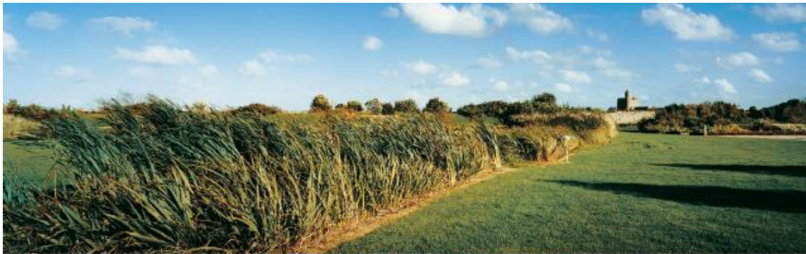
Paysage de Tatihou dominé par la silhouette de la tour Vauban