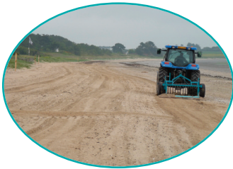
Situation en été et au printemps

Dans certaines communes, des panneaux expliquant le rôle de la laisse de mer sont affichés à l'entrée des plages pour que petit à petit, les mentalités changent et que ce qui est nécessaire à la vie sur la plage ne soit considéré ni comme sale, ni comme un déchet. Les déchets issus de l'activité des hommes sont aussi parfois ramassés à la main ce qui permet de ne pas toucher à la laisse de mer.