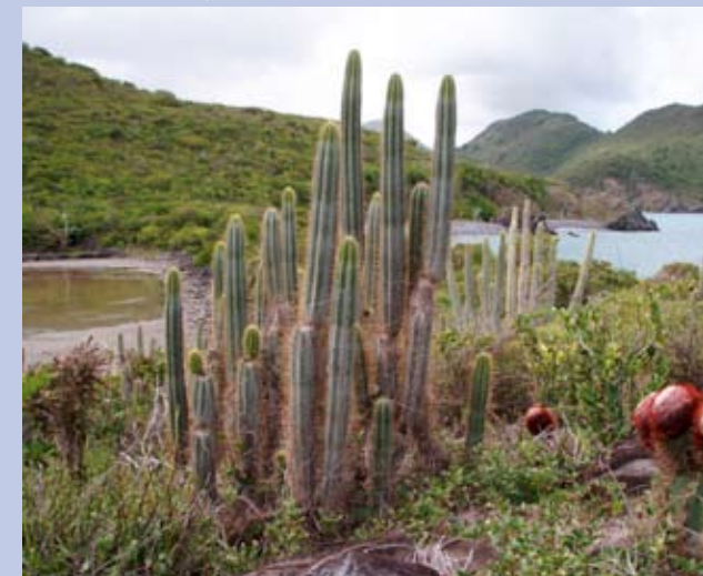
Pointe des Froussards, site de Red Rock

Un sentier botanique relie le quartier de l'Anse Marcel à Grandes Cayes-Cul-de-Sac. Il permet d'arpenter ce littoral sauvage, tout en découvrant la flore saint-martinoise, le long de points de vue remarquables tels la Pointe des Froussards et Eastern Point. À Red Rock, 28 hectares sont actuellement préservés par le Conservatoire. Ce site d'exception bénéficie d'une priorité d'intervention.