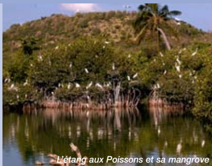
L'étang aux Poissons et sa mangrove

L'île de Saint-Martin comporte de multiples étangs et lagunes, pour la plupart encadrés de mangrove. Leurs fonctions écologiques sont majeures : régulation et canalisation des eaux de pluie, décantation des alluvions, épuration des eaux, refuge et lieu de reproduction de la faune marine et aviaire... Pas moins de 85 espèces d'oiseaux fréquentent ces zones humides pour se reproduire, se nourrir ou se reposer en période migratoire. Ces milieux ont pourtant subi, et subissent encore, une pression anthropique