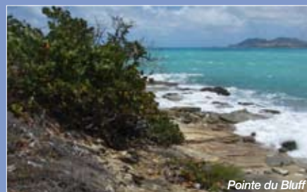
Pointe du Bluff

Afin de préserver ces milieux littoraux vulnérables, il est nécessaire de concilier protection foncière terrestre, protection réglementaire marine et gestion des sites. Pour la mise en œuvre et la coordination de la gestion intégrée des rivages, un partenariat fort lie l'établissement au gestionnaire des sites, la Réserve naturelle nationale de Saint-Martin.