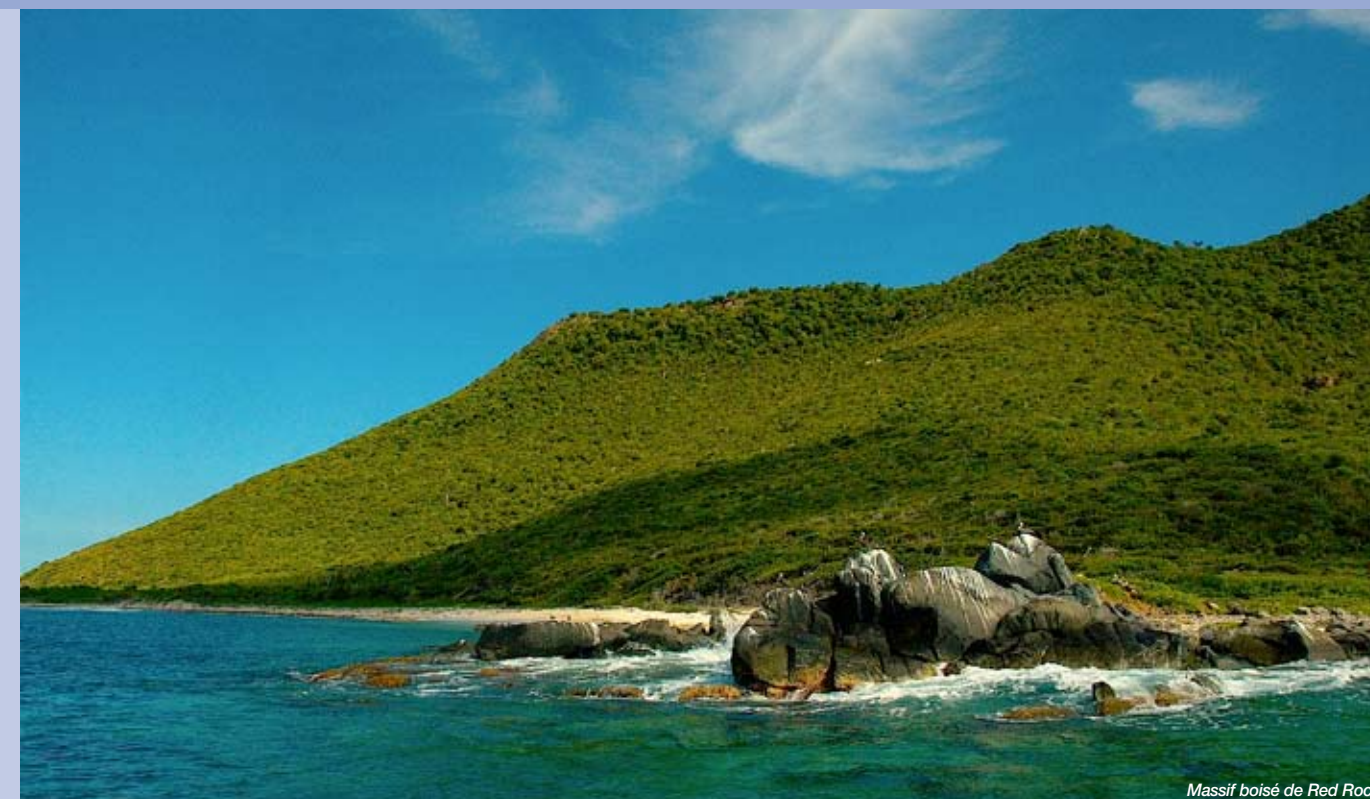
Massif boisé de Red Rock

Au total, 84 hectares de rivages terrestres sont sous la protection du Conservatoire du littoral. Ces acquisitions contribuent à maintenir des trames vertes de la terre vers la mer entre les divers secteurs déjà urbanisés de l'île. Les rivages terrestres affectés au Conservatoire et encerclant les Salines d'Orient et la baie de l'Embouchure jouent, en outre, le rôle de zones tampon entre les étangs et les zones urbaines.