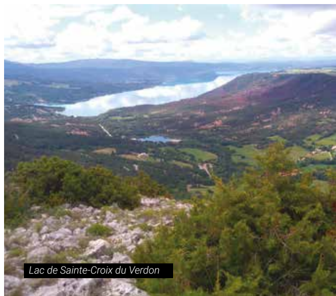
Lac de Sainte-Croix du Verdon

Le Conservatoire a acquis le 16 mars 2018 les 5/7e indivis d'une propriété de 46 ha située à l'entrée des grandes gorges du Verdon, au cœur du Parc naturel régional éponyme, dominant le magnifique lac de Sainte-Croix. Les négociations avaient débuté en 2010... Il a fallu convaincre la dizaine de copropriétaires et proposer aux non vendeurs d'exercer leur droit de préférence avant de préempter sur la déclaration de vente. Cette opération vient utilement compléter un site déjà important (240 ha) sur un balcon d'un grand intérêt paysager. Cependant, des travaux de restauration s'avèrent nécessaires pour notamment sauver une ancienne oliveraie colonisée par les genévriers et les pins d'Alep. La concertation se poursuit avec les deux indivisaires restants afin de renforcer à court terme la cohérence foncière de cet ensemble unique.