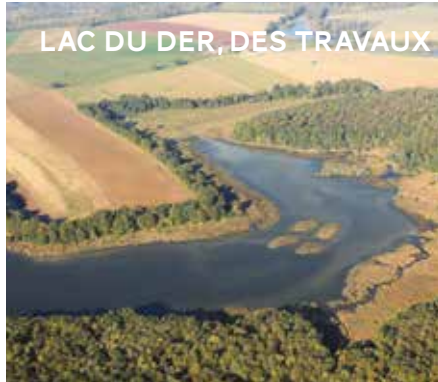
LAC DU DER, DES TRAVAUX