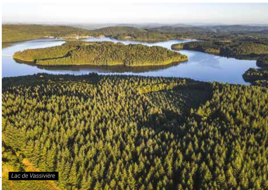
Lac de Vassivière