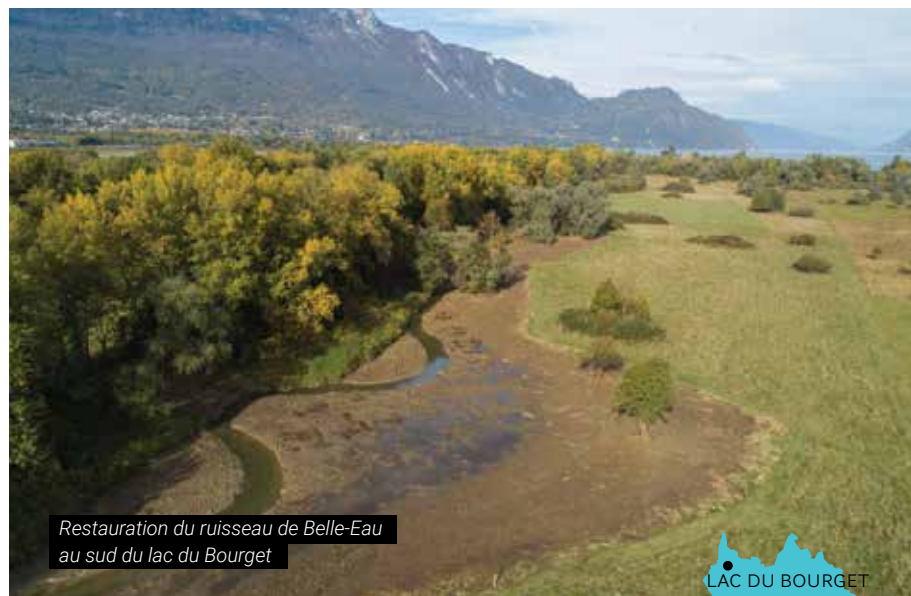
Restauration du ruisseau de Belle-Eau au sud du lac du Bourget