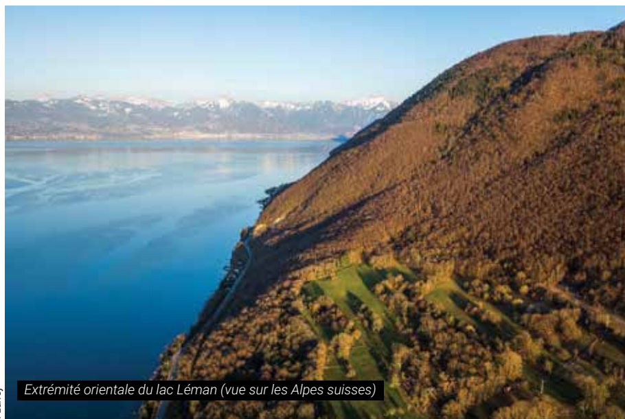
Extrémité orientale du lac Léman (vue sur les Alpes suisses)

Ce nouveau périmètre couvre environ 15 ha en excluant les propriétés bâties.