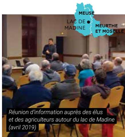
Réunion d'information auprès des élus et des agriculteurs autour du lac de Madine (avril 2019)

de périmètre d'intervention à l'échelle du lac de Madine, incluant des espaces-tampons autour des étangs mais aussi sur des zones humides en lien fonctionnel avec le lac, est en cours d'examen par les municipalités.