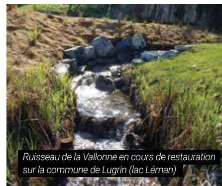
Ruisseau de la Vallonne en cours de restauration sur la commune de Lugrin (lac Léman)

Dans le cadre du chantier de requalification de la partie sud du site, les premiers aménagements avaient été emportés par deux crues successives lors de l'été 2017. Une seconde campagne de restauration plus ciblée a été conduite en octobre 2018. L'esprit des travaux dessinés initialement par le paysagiste a été respecté tout en stabilisant plus solidement les deux bras de ce ruisseau paysager. La partie nord du parc doit être à son tour traitée à partir de 2020 dans un esprit de sobriété et de valorisation du patrimoine arboré.