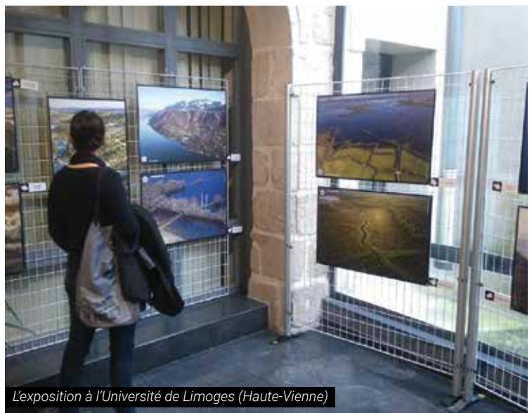
L'exposition à l'Université de Limoges (Haute-Vienne)

valorisation d'espaces naturels. Réhabilitation d'une ancienne ferme à Serre-Ponçon, restauration d'une zone humide au Bourget, réalisation d'études pour améliorer l'accueil autour du lac de Sainte-Croix du Verdon, autant d'initiatives qui ont bénéficié de fonds européens (Feder) depuis 2014. Le projet a été piloté par le Conservatoire d'espaces naturels de la Savoie.