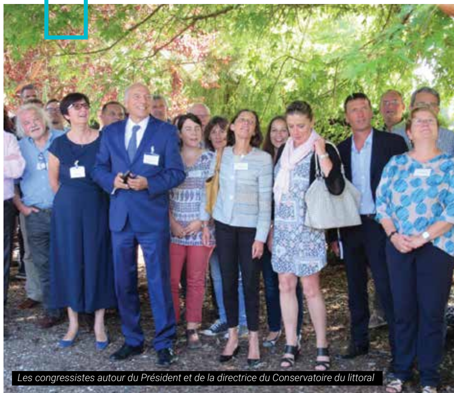
Les congressistes autour du Président et de la directrice du Conservatoire du littoral