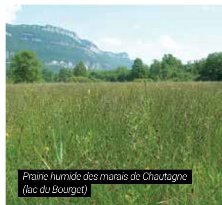
Prairie humide des marais de Chautagne (lac du Bourget)