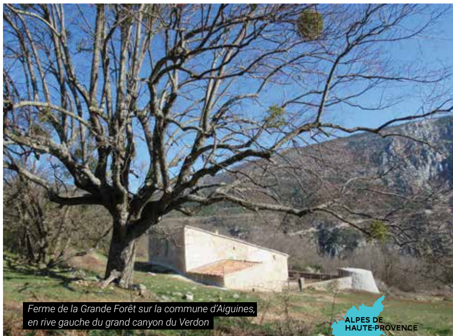
Ferme de la Grande Forêt sur la commune d'Aiguines, en rive gauche du grand canyon du Verdon

Le Conservatoire du littoral intervient sur 3 sites sur la rive droite (ouest) du lac de Vouglans (Jura). Plutôt que de réactualiser le plan de gestion du seul site de Sous les Côtes (Pont de Poitte) qui arrivait à échéance en 2019, les élus, le Département et l'établissement ont préféré élaborer un plan de gestion sur l'ensemble des périmètres d'intervention du Conservatoire en y associant les sites labellisés « espaces naturels sensibles » par le conseil départemental. Aurélie Nouri, accueillie conjointement par le Département et le Conservatoire dans le cadre de son stage de fin d'études, réalise de mars à août 2019 ce travail de synthèse visant à offrir une vision partagée à l'échelle d'un espace cohérent.