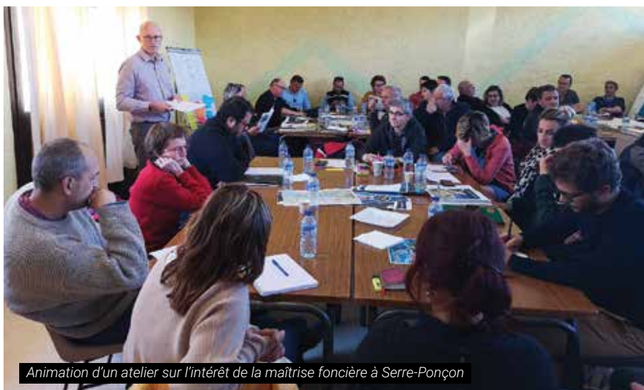
Animation d'un atelier sur l'intérêt de la maîtrise foncière à Serre-Ponçon

Le lac de Serre-Ponçon constitue l'une des plus imposantes réserves d'eau douce en France. Le Syndicat mixte d'aménagement et de développement, qui a élaboré un Plan Paysage remarqué, et le Conservatoire du littoral, propriétaire de 80 ha sur deux sites, ont uni leurs compétences pour mieux préserver des milieux naturels, sauvegarder la biodiversité et reconquérir des espaces en voie de fermeture. La capacité d'agir nécessite en premier lieu de maîtriser le foncier. Une étude est en cours pour définir les secteurs d'intervention prioritaires sur lesquels le Conservatoire concentrera ses efforts de conviction envers les propriétaires privés, après avoir recueilli l'avis favorable des communes concernées.