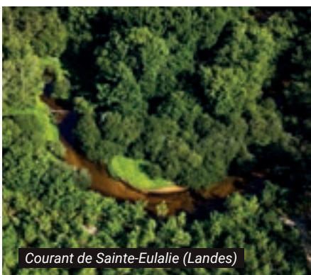
Courant de Sainte-Eulalie (Landes)

Sur 244 kilomètres, le cordon dunaire atlantique borde l'immense plage de sable et protège le plus grand massif forestier