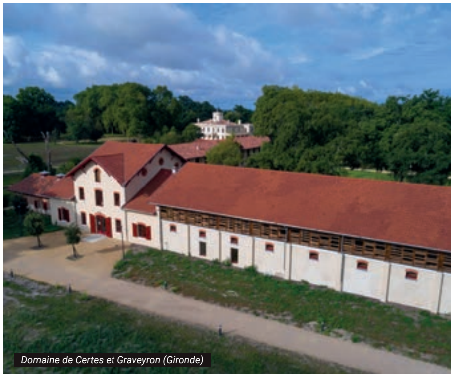
Domaine de Certes et Graveyron (Gironde)

DÉLÉGATION AQUITAINE 74 rue Georges Bonnac • 33000 BORDEAUX • Tél. 05 57 81 23 23 aquitaine@conservatoire-du-littoral.fr