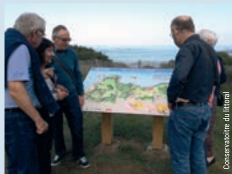
Conservatoire du littoral

Mais victimes de leur succès, nos sites, vastes espaces perçus « sans contrainte » attirent de plus en plus les organisateurs de manifestations et de nouveaux usages. Chaque demande est soumise à une analyse au cas par cas en fonction de l'impact et de l'intérêt pour le site.