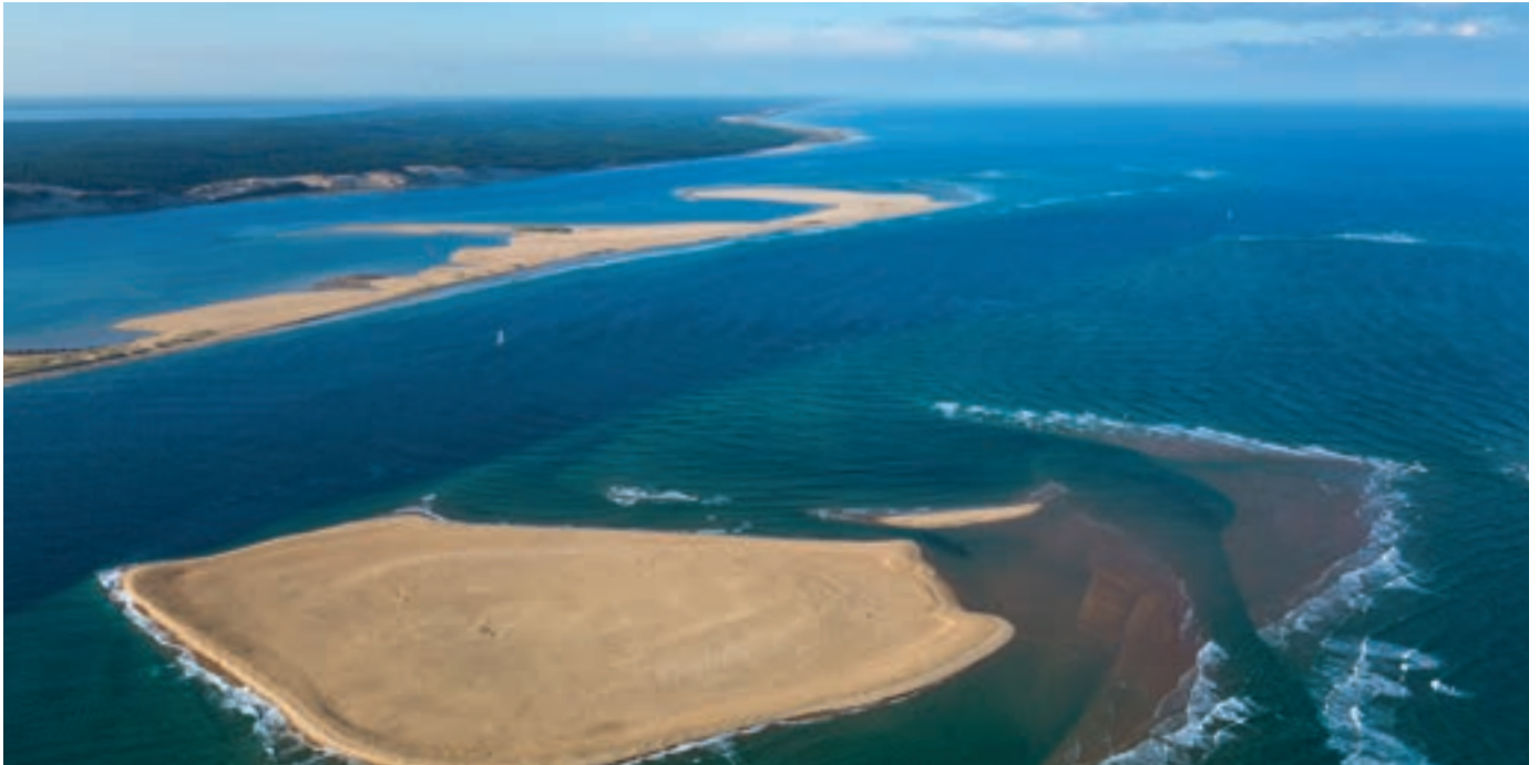
Passes du Bassin d'Arcachon (Gironde)