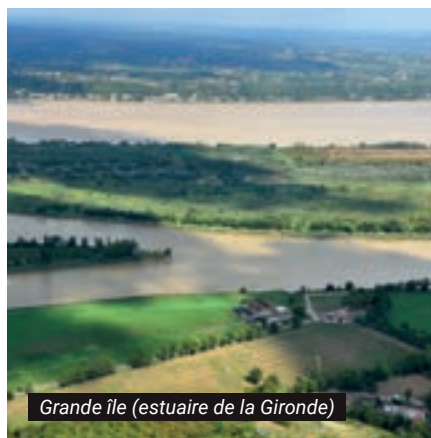
Grande île (estuaire de la Gironde)