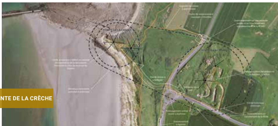
POINTE DE LA CRÈCHE

Le réseau d'observation du littoral est désormais doté d'une personnalité juridique propre qui lui permet de conforter son action à l'échelle des deux Régions Normandie et Hauts-de-France. Le Conservatoire du littoral en est membre, aux côtés des deux Régions et des DREAL de la façade.