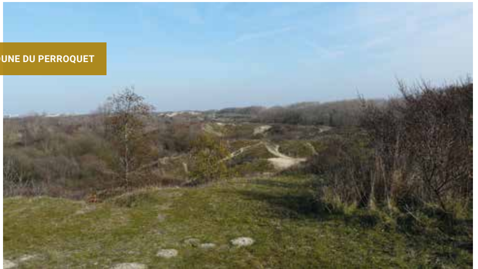
DUNE DU PERROQUET

Afin de protéger l'ensemble du site de la dune du Perroquet et restaurer des habitats naturels d'intérêt communautaire, un arrêté de Déclaration d'Utilité Publique a été pris par le Sous-préfet de Dunkerque, permettant au Conservatoire d'acquérir 55 hectares de terrains naturels. En 2020, 11 parcelles de la dune du Calvaire à Bray-Dunes, pour une superficie totale de 18 hectares, sont devenues propriété de l'établissement. Cette acquisition a bénéficié du financement européen Life + Nature « FLANDRE ».