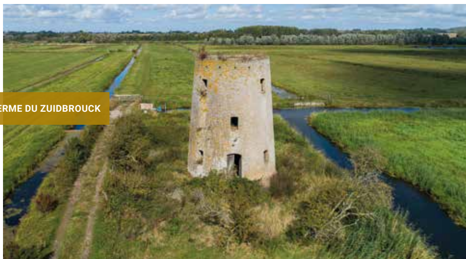
FERME DU ZUIDBROUCK

Après des travaux de restauration en 2019 dans le cadre de l'appel à projet de l'Agence de l'eau, une convention de pâturage expérimental a été signée en 2020 avec l'Asinerie du Marquenterre, permettant à un cheptel ovin et asin d'entretenir les paysages dunaires du Marquenterre sur plus de 30 hectares.