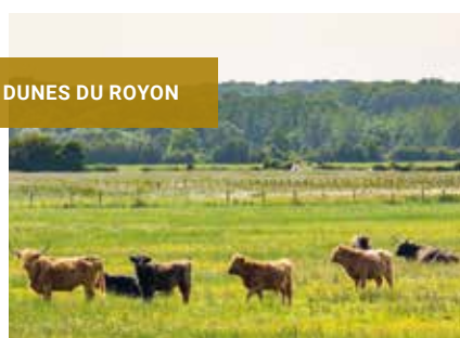
DUNES DU ROYON

Le 5 mars 2020, le Conservatoire du littoral a signé avec l'Agence de l'eau Artois-Picardie, le Département de la Somme, la Chambre d'Agriculture de la Somme et le Conservatoire d'Espaces Naturels de Picardie la convention de partenariat renouvelant le Programme de Maintien de l'Agriculture en Zone Humide (PMAZH) sur la Moyenne vallée de la Somme. Depuis 2009, le PMAZH vise à coordonner les interventions des partenaires pour développer des projets alliant préservation des zones humides et accompagnement des éleveurs. La mise à disposition de foncier public par le Conservatoire du littoral peut ainsi être un atout pour soutenir des initiatives portées par des agriculteurs.