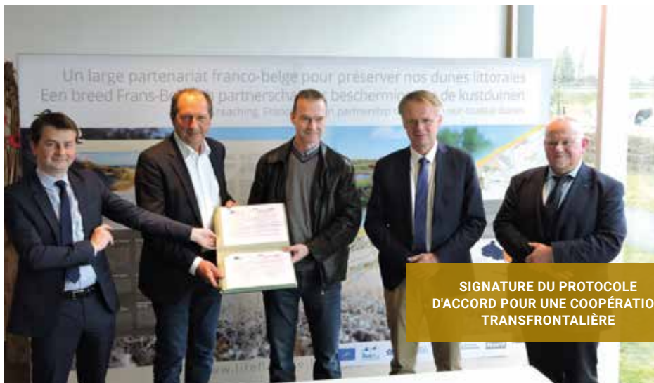
SIGNATURE DU PROTOCOLE D'ACCORD POUR UNE COOPÉRATION TRANSFRONTALIÈRE

littoral situé entre les estuaires de la Canche et de l'Authie. Dans la Somme, le syndicat mixte Baie de Somme-Grand littoral picard a élaboré le plan de gestion des marais de la Maye, composés de trois marais tourbeux situés le long du fleuve côtier.