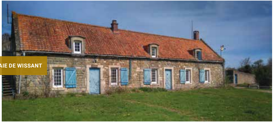
BAIE DE WISSANT

Une première pour la délégation Manche Mer du Nord qui a engagé, sur les communes de Wissant et Tardinghen, un projet de rénovation transformant une belle longère en pierres de taille en deux gîtes. C'est un programme de travaux ambitieux avec une rénovation énergétique exemplaire, la mobilisation de matériaux biosourcés, le recours à l'insertion et l'ouverture du chantier à des stages participatifs ouverts à tous. Dès le lancement du projet de rénovation, la